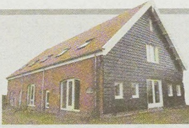
De tot Thomashuis verbouwde woonboerderij uit 1900 aan de Zandweg in Kruiningen.